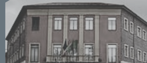
Sala Gordón Ordás. Edificio El Albéitar. Avda. de la Facultad, 25.